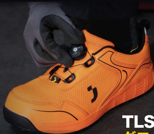
LOBI S1P LOW TLS